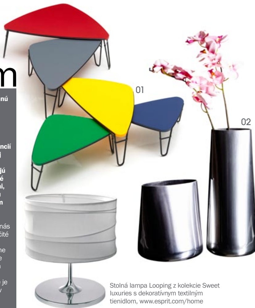
Stolná lampa Looping z kolekcie Sweet luxuries s dekoratívnym textilným tienidlom, www.esprit.com/home

Veľa ľudí má doma peknú zbierku spomienkových predmetov, ktoré majú pre nich emocionálnu hodnotu bez ohľadu na dizajn. Myslieť by sme mali hlavne na to, že každý doplnok, solitér má mať v interiéru svoje opodstatnenie, nejaký zmysel. Vyhnúť by sme sa mali bezhlavému zapratávaniu interiérov rôznymi doplnkami neidentifikovateľných štýlov, materiálov a uletených farieb. Tak ako v móde aj v interiérovom dizajne vznikajú stále nové trendy, ktoré by sme mali sledovať a doplnky časom obmieňať.