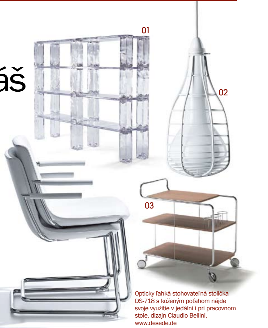
03 Opticky ľahká stohovateľná stolička DS-718 s koženým potahom nájde svoje využitie v jedálni i pri pracovnom stole, dizajn Claudio Bellini, www.desede.de

Sú všeobecne známe klasické triky na zväčšenie priestoru. Treba sa vyhýbať tmavým farbám, ktoré priestor opticky zmenšujú. Zariadenie interiéru by malo byť jednoduché, čisto účelné. Nábytok, osvetlenie aj dekorácia by mali byť v jednom štýle, aby sa priestor nedell na ďalšie menšie časti. Veľakrát je náročné bývanie so staršou generáciou, ktorá uskladňuje roky nepotrebné a nefunkčné veci. Prvým krokom je presvedčiť babičku o tom, že starú, pokazenú žehličku skutočne nikdy nevyužijeme!