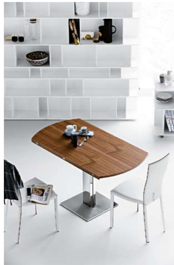
05 Rozkladací jedáľenský stôl Elvis Turn s oceleovou základňou a doskou z orechového dreva dokáže meniť svoju veľkosť i tvar dizajn Alberto Danese, www.cattelanitalia.it