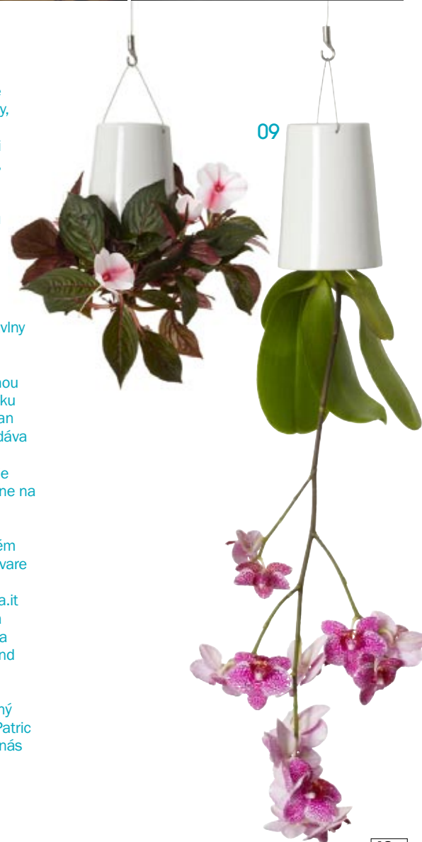
09 Závesný model štýlového črepníka Sky Planter je obtočený rastlinami dolu hlavou, dizajn Patric Morrison, www.boskke.com , u nás predáva www.unim.sk