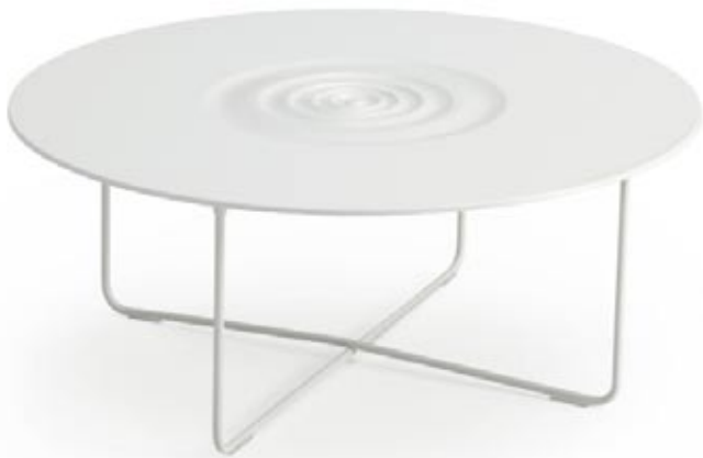
Medzi novinky z milánskeho Design Weeku patril aj stolík Droplet s leštenou doskou zo špeciálneho materiálu Penta Decor®, dizajn Ingunn Eikeland Bjorkelo, www.offeect.se